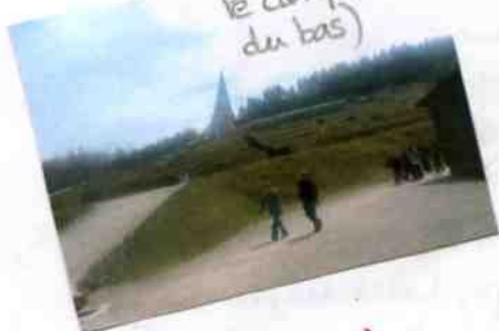
Le camp (vue du bas)