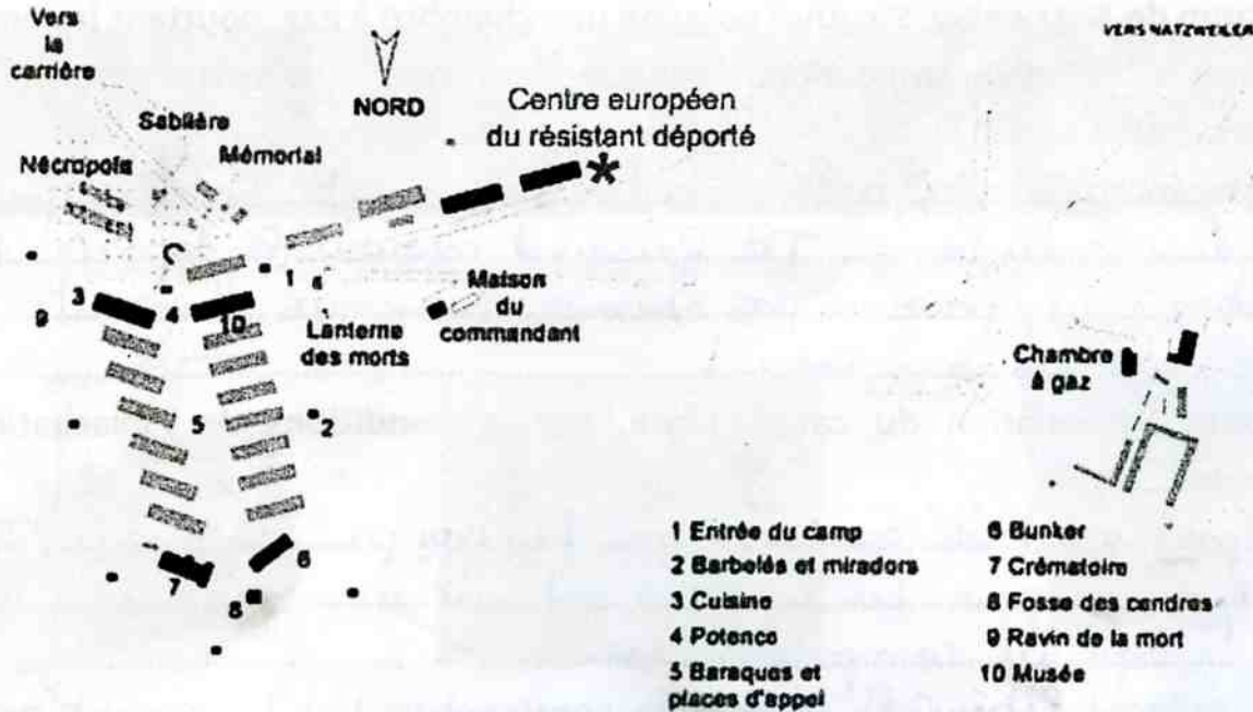
Plan du camp de Natzweiler-Struthof.

5. Raconte à la manière d'un guide la première journée d'un déporté au camp et une journée-type. Pense à faire une phrase de transition entre les deux paragraphes.