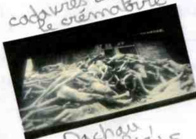
Dachau avril 1945