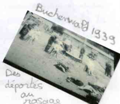
Buchenwald 1939 Des déportés au rasage