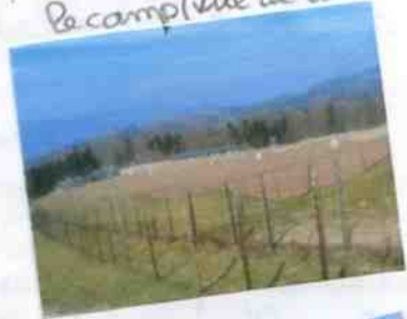
Le camp (vue de dehors)